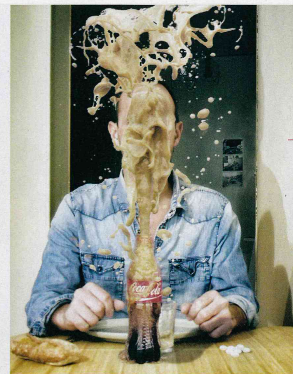
Ne manquez pas au Siac le travail d'autoportrait du photographe David Dauba.